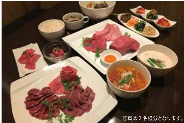
写真は2名様分となります。